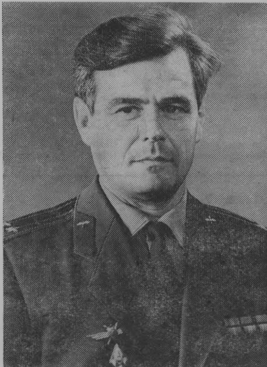
Командир космического корабля «Союз-12» Василий Григорьевич Лазарев. Борт-инженер космического корабля «Союз-12» Олег Григорьевич Макаров.