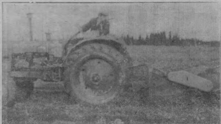
Уборка картофеля в совхозе «Вязшенерский»