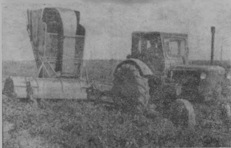
Уборка ботвы на силос.