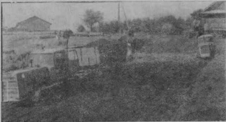
Закладка силоса в траншею.