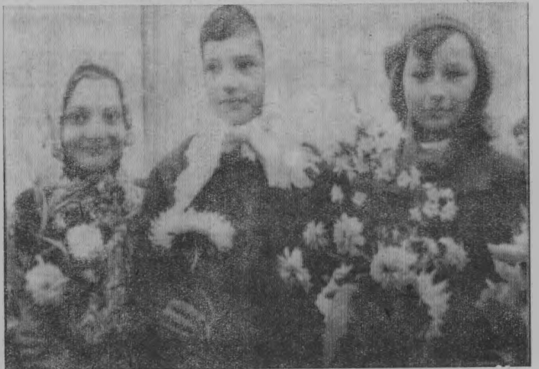
Радостная встреча со школой, учителями, друзьями.

При подведении итогов социалистического соревнования за июль Арбинскому лесопункту было присуждено первое место с вручением переходящего Красного знамени.