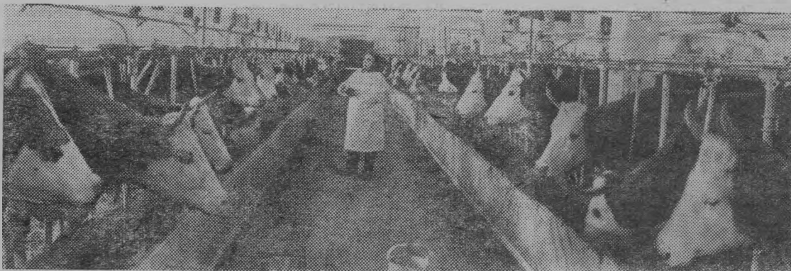
Самый крупный в Ярославской области механизированный животноводческий комплекс на 800 коров сдан недавно в эксплуатацию в опытно-производственном хозяйстве «Михайловское».

Предприятия Белоруссии, Литвы уже накопили опыт выработки продукции по рецептам, рассчитанным электронно-вычислительными машинами. В этих рецептах цены на комбикорма устанавливаются исходя из стоимости сырья. Такая практика позволяет подобрать рецепты кормов, оптимальные по качеству и себестоимости. А это дает возможность более эффективно использовать сырье, особенно белковое, и наращивать производство продукции.