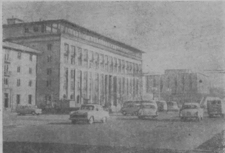
Столица Узбекистана — Ташкент. Проспект имени В. И. Ленина.

Генеральный секретарь ЦК КПСС Л. И. Брежнев в докладе «Пятьдесят лет великих побед социализма» говорил: «Единство многонационального советского народа прочно, как алмаз. И как алмаз переливается многоцветьем граней, так и единство нашего народа сверкает многообразием составляющих его наций, каждая из которых живет богатой, полнокровной, свободной и счастливой жизнью».