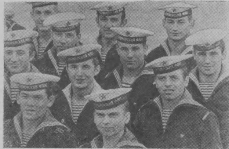
Краснознаменный Черноморский флот. «Все, что народом создано — защищать надежно, бдительно, стойко!» — под таким девизом в год 50-летия образования СССР вместе со всеми Вооруженными Силами нашей страны несут вахту моряки Краснознаменного Черноморского флота. Широко развернув социалистическое соревнование за достижения наивысшего мастерства, черноморцы настойчиво изучают вверенную им технику и оружие, множат ряды отличников боевой и политической подготовки, классных специалистов.

Претворяя в жизнь исторические решения XXIV съезда ленинской партии, личный состав Военно-Морского Флота СССР совершенствует боеготовность кораблей и частей, зорко стоящих на страже завоеваний Великого Октября. В традиционный праздник — День Военно-Морского Флота — матросы, старшины, мичманы, прапорщики, офицеры, генералы и адмиралы рапортуют об этом Родине, партии и народу.