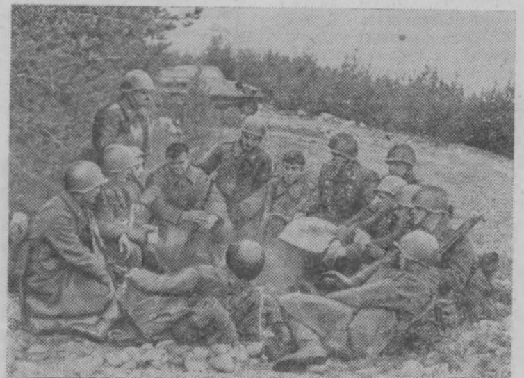
Политинформация на привале.