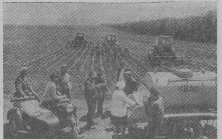
Молдавская ССР. Кооператоры Чимилийского района работают на полевых работах. В поле привозят завтраки, обеды, прохладительные напитки.

Тоншаевская типография Горьковского облуправления по печати. Заказ 535 Тираж 4063