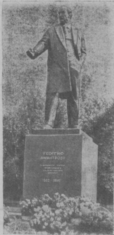
Москва. Памятник Георгию Димитрову, выдающемуся деятелю международного коммунистического движения, верно сыну болгарского народа. Открыт в связи с 90-летием со дня рождения Георгия Димитрова.