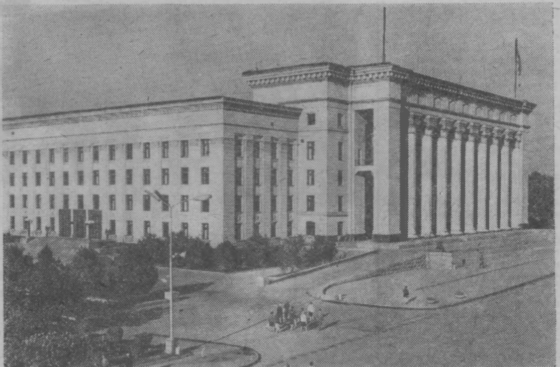
Алма-Ата, Дом правительства Казахской ССР.

В девятой пятилетке в Алма-Ате возведут квартиры для четверти миллиона человек. Сейчас строится цирк, художественная галерея, аэровокзал, городок Казахского государственного университета на десять тысяч студентов, здания нескольких научно-исследовательских институтов.