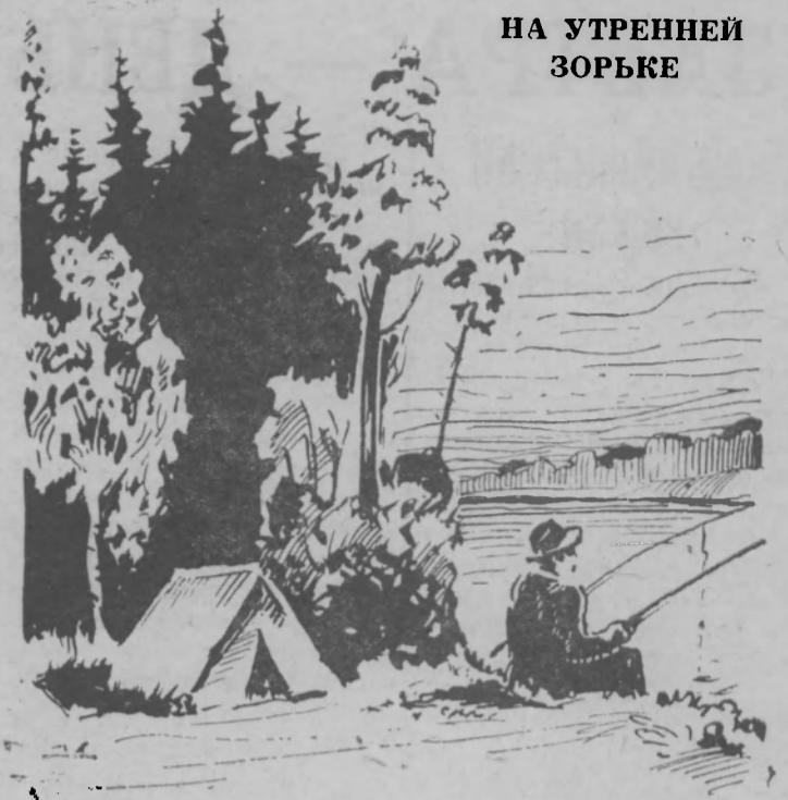
НА УТРЕННЕЙ ЗОРЬКЕ

А сколько кругом цветов! Незабудок, анютиных глазок, ромашек, колокольчиков. Куда ни посмотри — везде цветы и цветы.