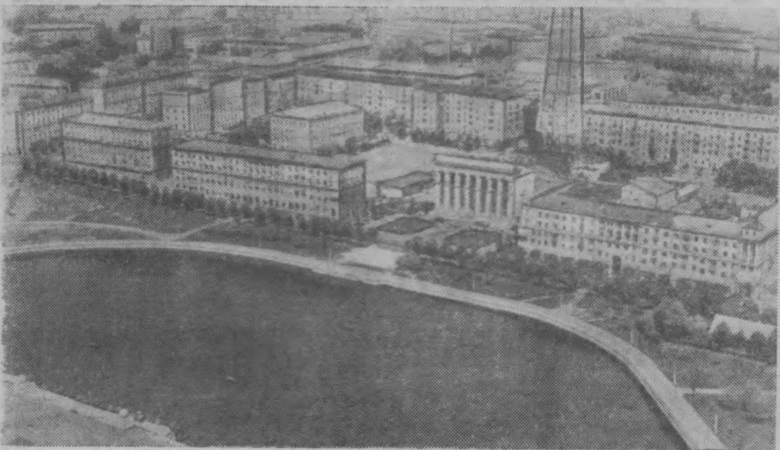
Столица Белоруссии — Минск. Центральная часть города.

В 35 километрах от Себежа — старинного русского города, с трех сторон омываемого озерами, сходятся границы Российской Федерации, Белоруссии и Латвии. Пограничная зона — березовые рощи и хвой-