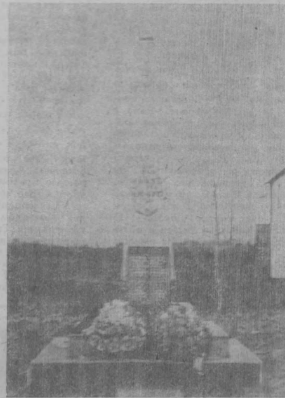
На снимке: обелиск в пос. Шерстки.

День 9 мая для жителей поселка Шерстки был двойным праздником. В этот день состоялась церемония открытия обелиска землякам, павшим в годы Великой Отечественной войны за освобождение нашей Родины от фашистских полчищ. К подножию обелиска были возложены венки.