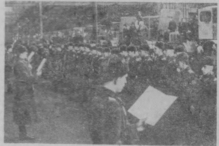
По традиции цехи Кировского завода ежегодно широко распахивают свои двери для военного строя. На родной завод приходит вчерашние рабочие, чтобы перед лицом своих друзей и старших товарищей дать военную клятву на верность народу.

На снимке: молодые ленинградцы принимают присягу в тракторосборочном цехе завода.