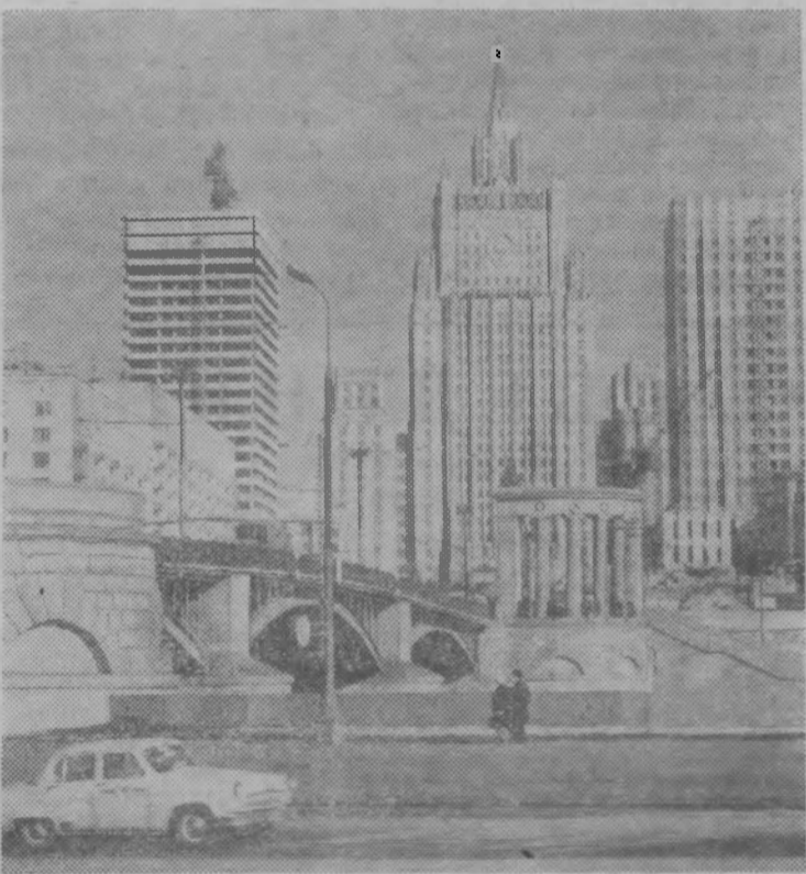
МОСКВА. В столице ведется большое строительство.

С конвейеров и сборочных станций завода сходят мощные электродвигатели и передвижные электрические станции, сварочные агрегаты для сельских механизаторов. В новом году ильичевцы послали свою продукцию мелиораторам Азербайджана, машиностроителям Бердянска и Слуцка. На этой неделе с подъездных путей досрочно отгружена партия электродвигателей для завода «Узбекхиммаш», находящегося в городе Чирчик.