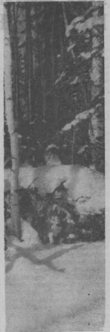
Снега лесные.

О двух концертах, состоявшихся в Большеселковском и Ромачинском клубах, рассказали нам А. Колина и А. Капралова.