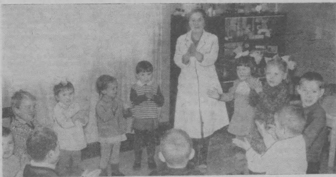
За детство счастливое наше, спасибо родная страна.