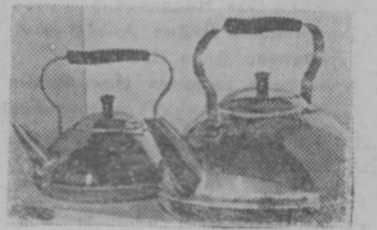
На снимке: чайники новой формы, изготовленные объединением «Ленмашэлектроприбор». Они будут выпускаться в 1972 году.

Скрябин воспел мощь и красоту человеческого духа. Наиболее известны его произведения — поэмы «Прометей», «Божественная», «Мечты», «Поэма экстаза», фортепьянные миниатюры «Хрупкость», «Ирония» и другие.