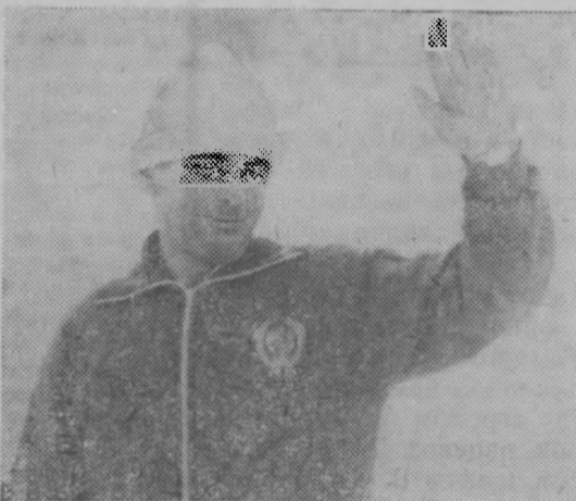
На снимке: Вячеслав Веденин после победы.

Саппоро. XI Белая олимпиада. Первую золотую медаль советской команде принес Вячеслав Веденин (Москва), который выиграл лыжную гонку на 30 километров со временем 1 час 36 минут 31,15 секунды.