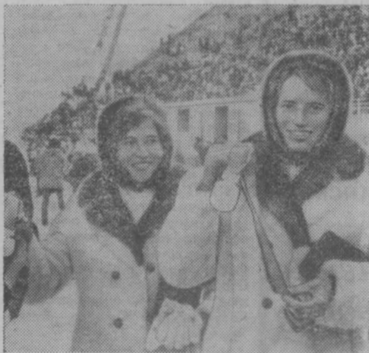
Саппоро. XI Белая олимпиада. Лыжница из Ижевска Галина Кулакова завоевала золотую олимпийскую медаль в 10-километровой гонке — 34 минуты 17,82 секунды.