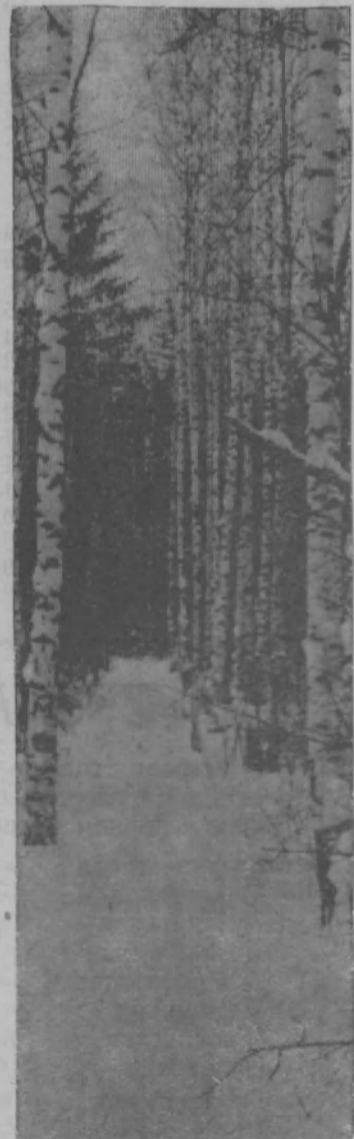
Зимний пейзаж.