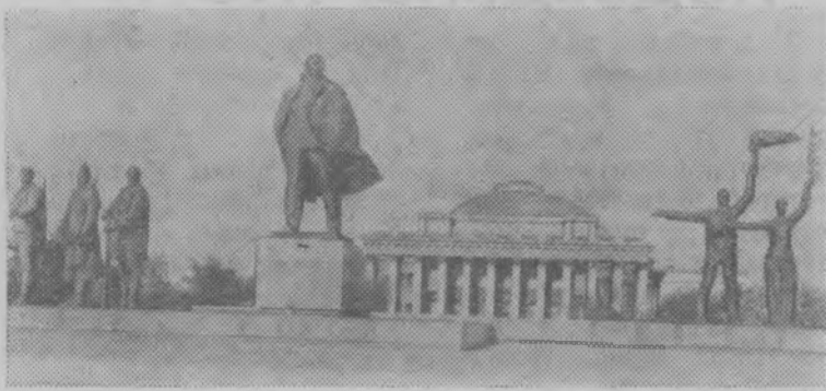
Новосибирск—крупный промышленный, научный и культурный центр страны с населением более миллиона человек. На снимке: Новосибирск. Памятник В. И. Ленину на площади его имени.