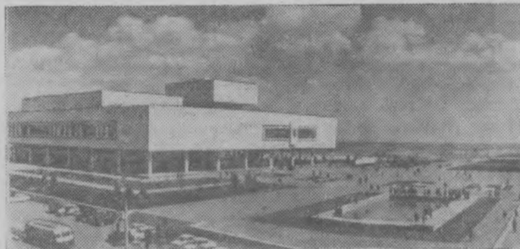
Ульяновск. Ленинский мемориальный комплекс.