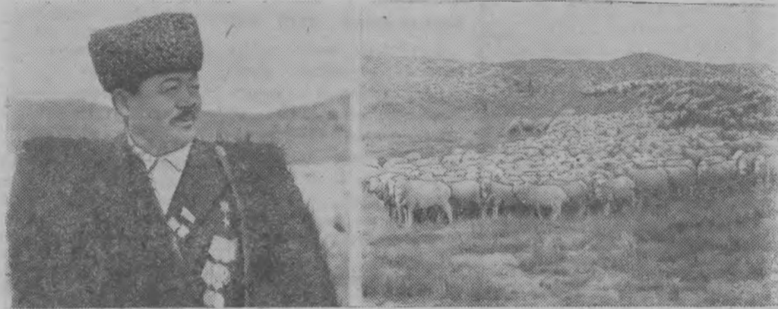
Чечено-Ингушская АССР. Ордена Ленина племсовхоз «Шелковский» — одно из передовых хозяйств страны. Из года в год здесь получают высокие настриги шерсти. Третий квартал подряд коллектив удерживает переходящее Красное знамя Министерства сельского хозяйства СССР и ЦК профсоюза рабочих и служащих сельского хозяйства и заготовок. Его достижения отмечены