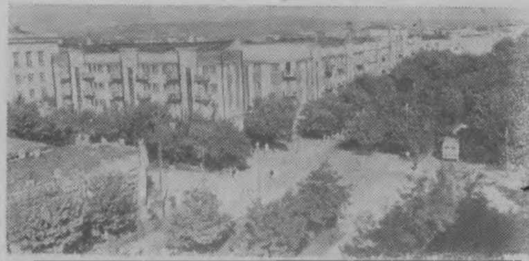
Редактор А. В. МАЛЬЦЕВ.