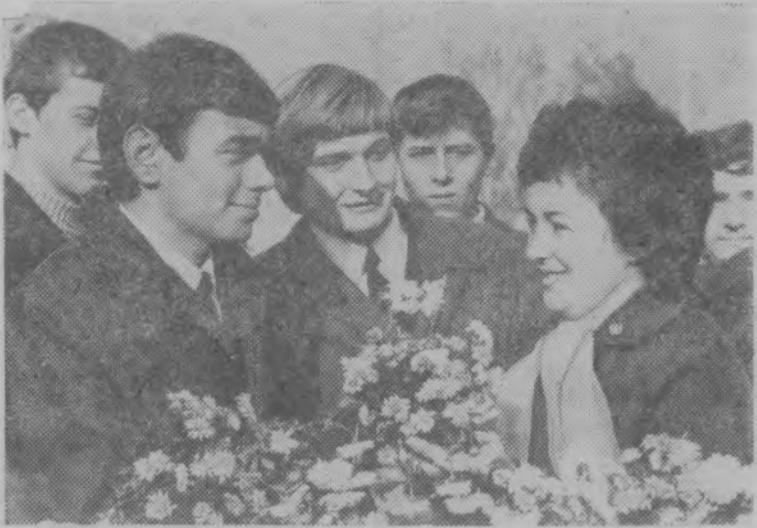
Украинская ССР. На Ровенщине стало традицией торжественно провожать юношей на службу в ряды Советской Армии.

Недавно состоялся День призывника в областном центре. На торжественные проводы юношей пришли старые коммунисты, ветераны гражданской и Великой Отечественной войн, учащиеся школ и техникумов, родители. Они собрались на площади В. И. Ленина у памятника вождю пролетариата. Здесь от ровенчан будущим воинам были вручены наказы на верность служения великой Родине Октября, преподнесены букеты цветов.