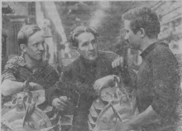
Продукция московского завода «Динамо» имени С. М. Кирова расходуется по всей стране и за рубежом. Это двигатели для вагонов метро, трамваев, кранов, морских судов и еще десятки наименований различных машин. Многотысячный коллектив машиностроителей несет