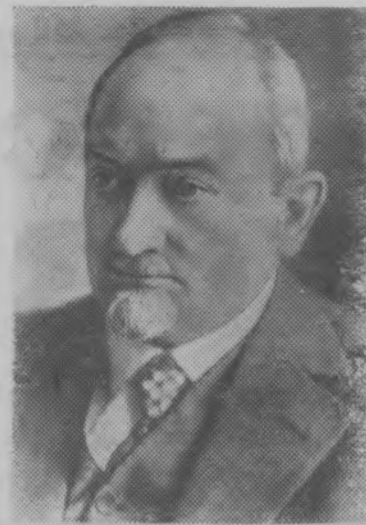
24 ноября исполняется 100 лет со дня рождения Георгия Васильевича Чичерина. Г. В. Чичерин (1872—1936) — видный советский государственный деятель, выдающийся дипломат ленинской школы.

Ход революционных событий, подтвердивший стратегию и тактику ленинизма, привел его в партию большевиков. Выдвинутый после победы Великой Октябрьской революции на работу в Народный комиссариат иностранных дел, Чичерин, гибко используя международную обстановку, активно проводит внешнюю политику Советской страны. В тесном сотрудничестве с В. И. Лениным Г. В. Чичерин заложил теоретические основы советской дипломатической службы. Он представлял Советское государство на международных конференциях в Брест-Литовске, Генуе и Лозанне.