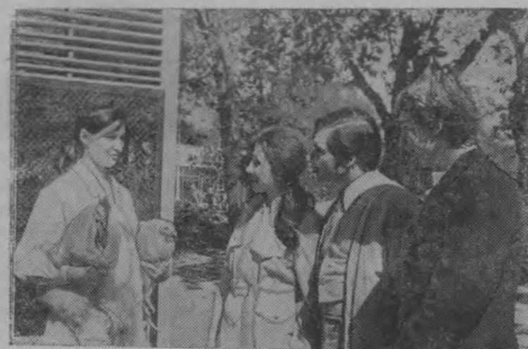
Москва. На ВДНХ СССР проходит смотр сельскохозяйственной

племенной птицы. Около 30 передовых птицеводческих хозяйств РСФСР,