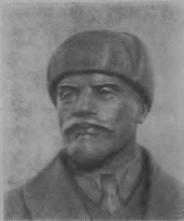
Москва. В Центральном выставочном зале открылась выставка художников Российской Федерации, посвященная 50-летию образования СССР. На выставке представлены произведения живописи, скульптуры, графики, монументального, театрально-декоративного и декоративно-прикладного искусства. В экспозицию включено около полутора тысяч работ более тысячи авторов. Произведения художников свидетельствуют о неослабевающих связях искусства социалистического реализма с жизнью советского народа.