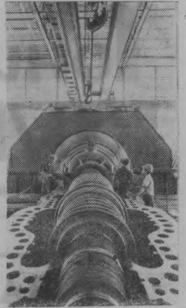
Узбекская ССР. В Голодной степи на берегу реки Сырдарья сооружается ГРЭС мощностью 4,4 миллиона киловатт. Ввод в действие ее первых агрегатов намечен Директивами XXIV съезда КПСС. Могучие котлы станции будут работать на природном газе.