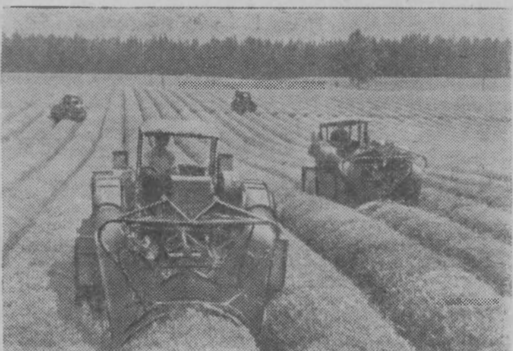
Грузинская ССР. На плантациях Очхамурского чаесовхоза Кобулетского района.

В Грузии издается 146 газет и 121 журнал общим тиражом свыше 3,9 млн. экз. 10 издательств ежегодно в среднем выпускают книги двух тысяч наименований тиражом более 12 миллионов экз.