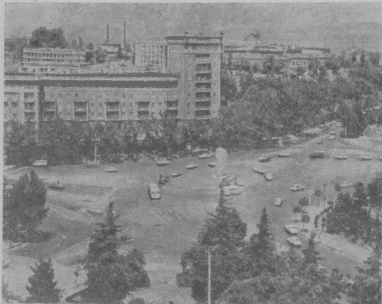
Столица Грузинской ССР — Тбилиси. Площадь Героев.

Л. И. Брежнев, выступая на торжественном заседании в Тбилиси, сказал, что путь, которым шла и идет Грузия, — это путь всего нашего великого содружества народов, что сама природа социалистического общественного строя, последовательное осуществление ленинской национальной политики сплотили народы нашей страны, превратили их дружбу в движущую силу развития советского общества, в неиссякаемый источник энергии и творчества всех наций и народностей Советского Союза.