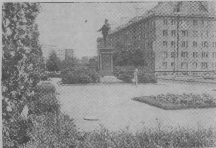
Столица Эстонской ССР — Таллин. Памятник В. И. Ленину.

Меняется облик эстонской деревни. Повсеместно создаются благоустроенные колхозные и совхозные поселки. Более половины сельского населения уже переселилось из хуторов в новые, городского типа дома.