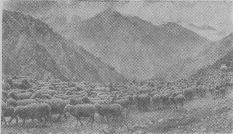
Киргизская ССР. Массовый перегон овец колхозов и совхозов Чуйской долины через перевал Тюя-Ашу на отдаленные пастбища.