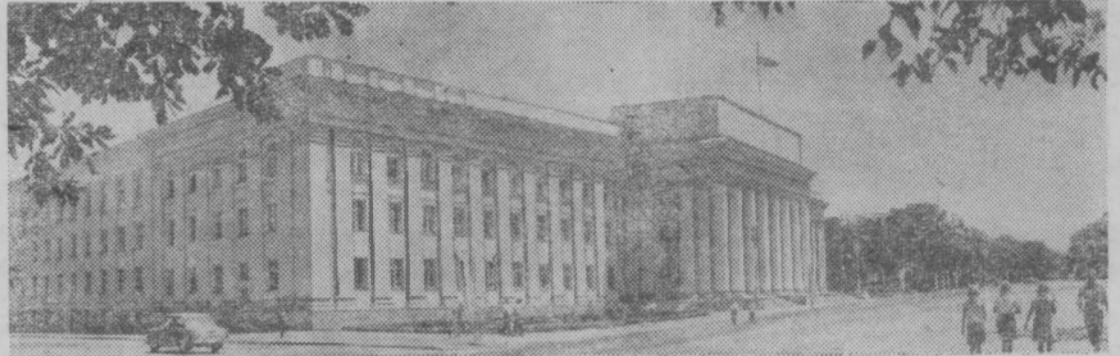
Столица Киргизской ССР — город Фрунзе. Центральная площадь.

Киргизский народ, как и все советские люди, уверенно смотрит в будущее. Эта уверенность обусловлена мудрым руководством Коммунистической партии, к которой советские люди питают безграничное доверие.