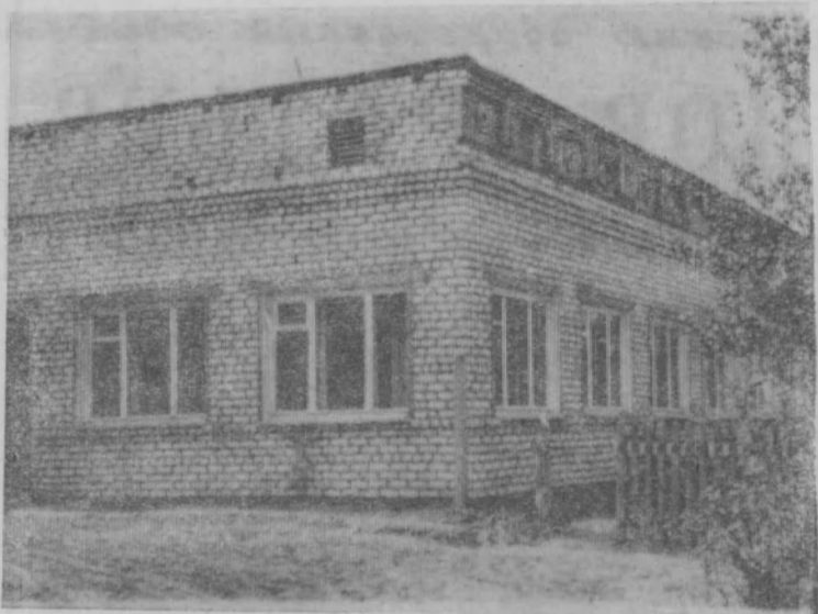
Пос. Пижма. Новая столовая Пижемского лес- промхоза.