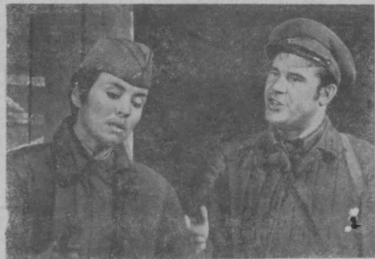
Редактор А. В. МАЛЬЦЕВ.