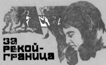
За рекой — граница

«Старики — разбойники» — очень смешная кинокомедия о двух друзьях, следователе и инженере, которые не хотят уходить на пенсию. В фильме принимают участие актеры Юрий Никулин, Евгений Евстигнеев, Ольга Аросева, Андрей Миронов.