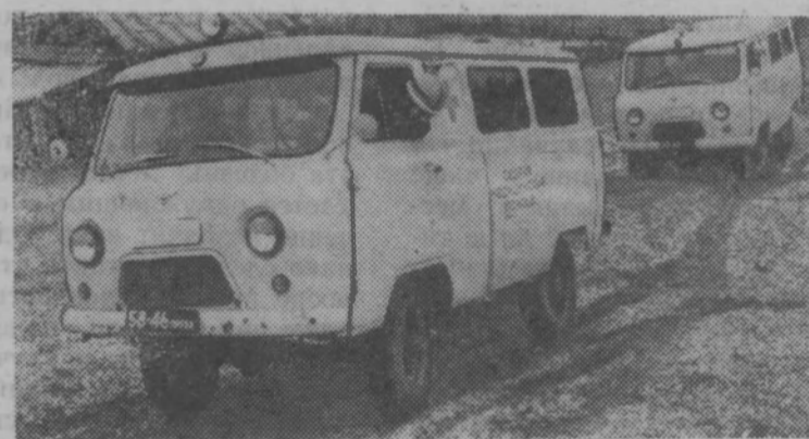
Конструкторы ульяновского автозавода имени Ленина создали машину «Скорой помощи» специально для сельской местности.

Выпуск новой санитарной машины намечен на Ульяновском автозаводе в этом пятилетии.