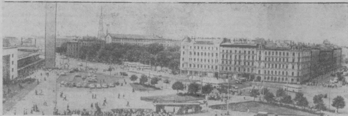
Столица Латвийской ССР—Рига. Привокзальная площадь.

Труженики Советской Латвии встречают светлый праздник дружбы братских народов новыми успехами в борьбе за претворение в жизнь исторических решений XXIV съезда партии.