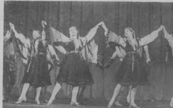
Большой популярностью в Риге пользуется ансамбль народного танца «Роталия» Дворца культуры завода ВЭФ. Самодеятельные артисты — рабочие и работницы завода — часто выступают на предприятиях и в колхозах Латвии. В репертуаре коллектива — танцы народов СССР.

На снимке: артисты ансамбля исполняют латышский танец «У Даугавы».