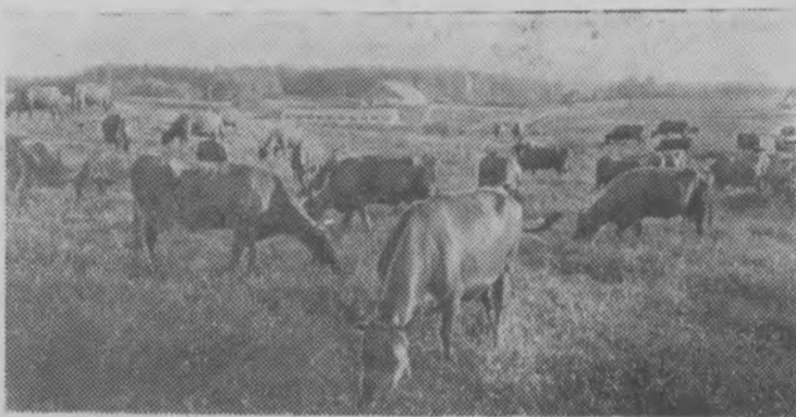
На снимке: на культурном пастбище совхоза «Саулескалнс» Краславского района. В среднем от каждой коровы здесь ежедневно получают по 16 килограммов молока.