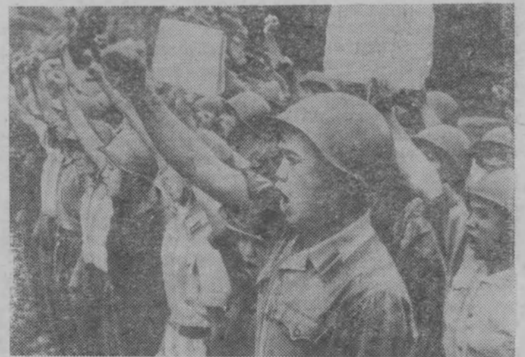
ДРВ. Бойцы противовоздушной обороны Хайфона клянутся отомстить американским агрессорам за кровь и слезы народа Вьетнама.