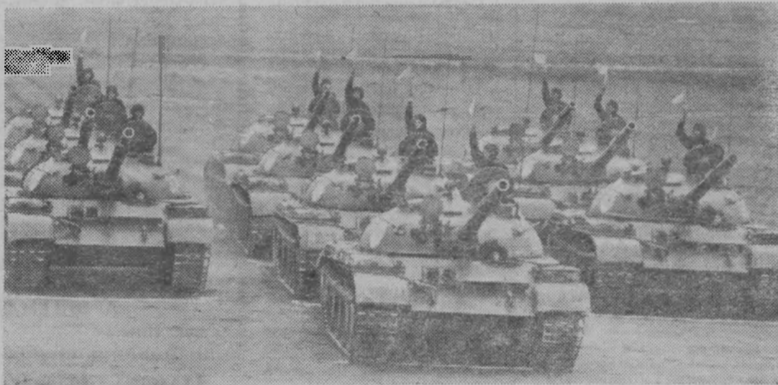
На снимке: танкисты на смотре войск после учений.