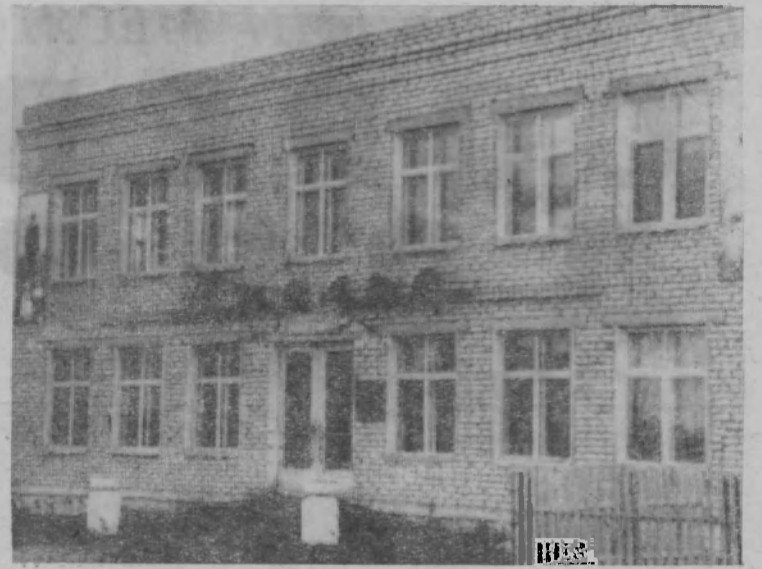
Село Тоншаево. Ателье.