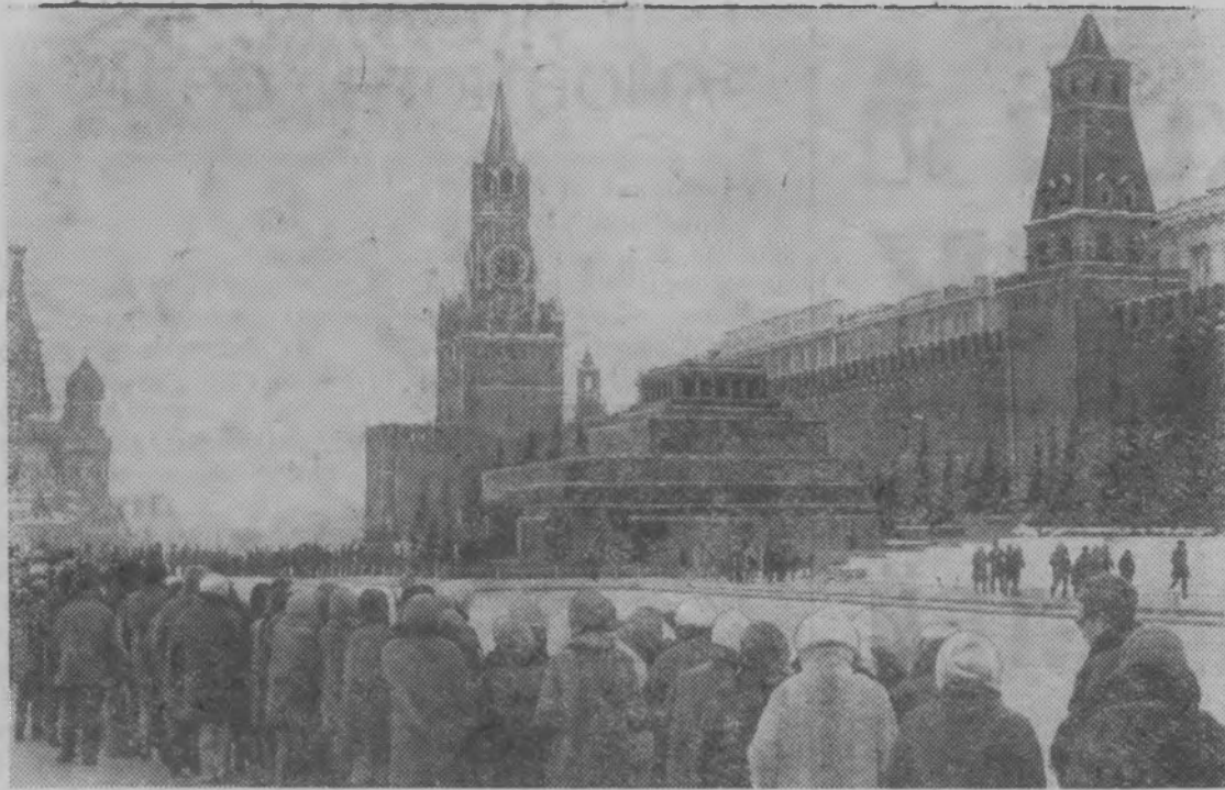
Москва. Красная площадь. Мавзолей В. И. Ленина.