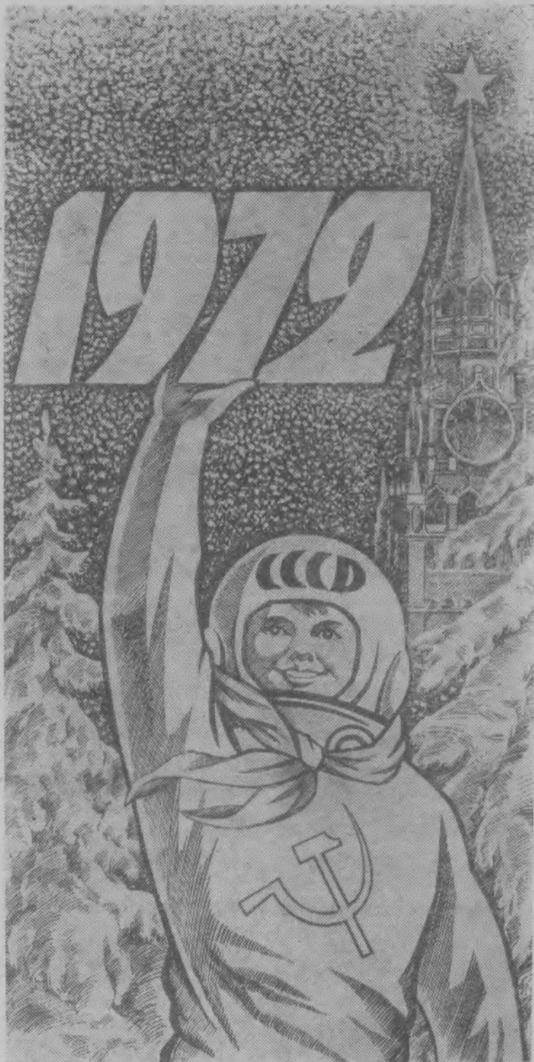
Рисунок С. Андреева.

В Новом году — к новым свершениям, дорогие земляки-тоншаевцы!