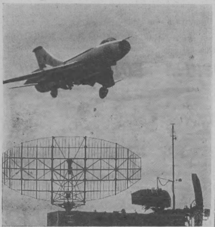
На снимке: истребитель-бомбардировщик уходит на задание.

Воины — авиаторы Советских Военно-Воздушных Сил изо дня в день настойчиво совершенствуют свою боевую выучку, уверенно овладевают высотами летного мастерства, увеличивая ряды классных специалистов. Почетное звание отличных носят многие экипажи, отряды и группы обслуживания.