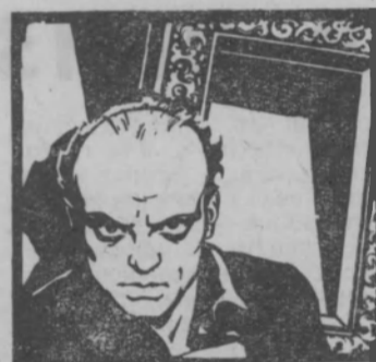
Возвращение святого Луки