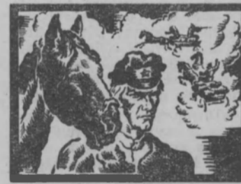
В ЛАЗОРЕВОЙ СТЕПИ

Американская широкоэкранная картина «Укрощение строптивой» поставлена по комедии В. Шекспира. По мнению специалистов — киноведов режиссеру удалось сохранить в картине дух великого произведения, его комедийную насыщенность и увидеть сквозь интригу и столкновение двух сильных характеров, зарождение подлинного чувства между Петруччо и Катариной. Фильм примечателен участием в нем знаменитых артистов Р. Бартона и Э. Тейлор.