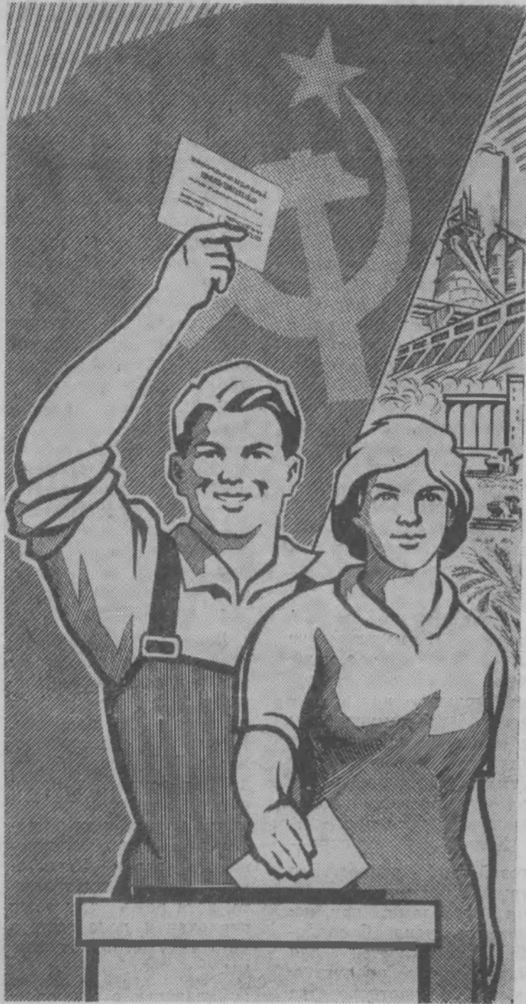
Плакат художника С. Андреева.