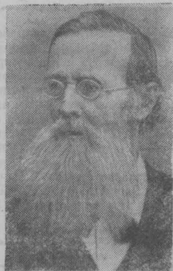
4 июня исполняется 150 лет со дня рождения известного русского поэта Аполлона Николаевича Майкова (1821—1897 гг.).

Его стихи, посвященные русской природе, отличаются задушевностью, акварельной тонкостью красок, напевностью. П. И. Чайковский на слова Майкова написал ряд романсов («Колыбельная песня», «Новогреческая песня»), «Торжественный марш и кантату «Москва».