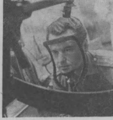
Командир космического корабля «Союз-10» В. А. Шаталов во время медицинских исследований.