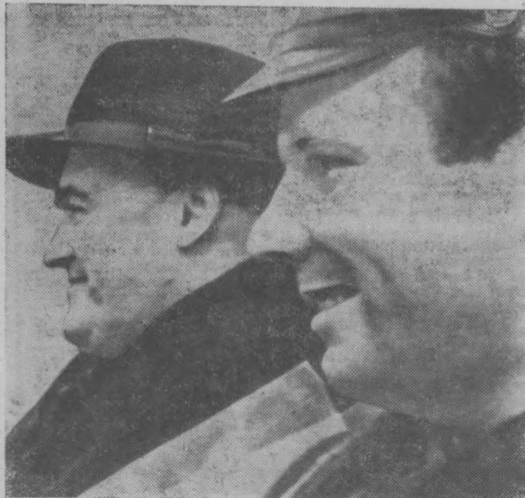
На снимке: академик С. П. Королев—создатель первых космических кораблей, летчик-космонавт Ю. А. Гагарин (космодром, октябрь 1964 года).

Каждый полет в космос важен для дальнейшего развития космической техники и решения практических вопросов на пути создания и функционирования долговременных орбитальных станций, в которых будут работать, сменяя друг друга, группы специалистов различных областей