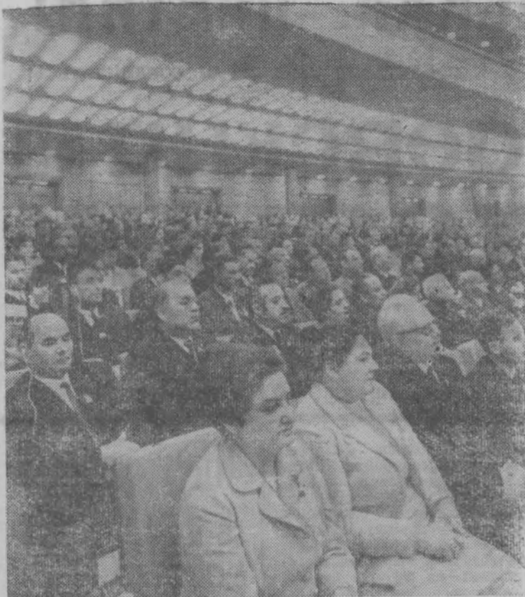
МОСКВА. XXIV съезд КПСС. На снимке: в зале Кремлевского Дворца съездов во время заседания.

На заботу партии о благе народа ответить делом — таково единодушное стремление рабочих Пижемского леспромхоза. А. ВАСИЛЬЕВ.