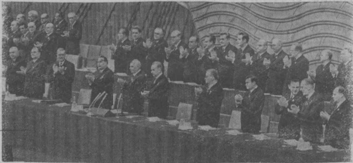
На снимке: в президиуме съезда.

Делегаты съезда единогласно принимают Заявление «За справедливый и прочный мир на Ближнем Востоке», в котором представители четырнадцатимиллионной армии советских комму-