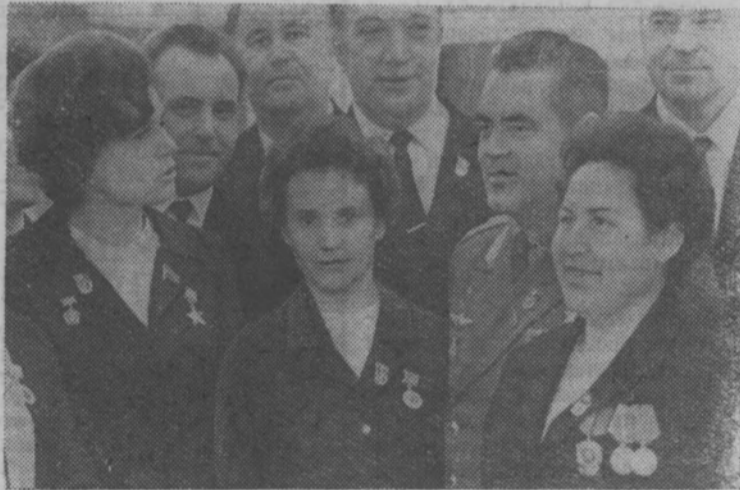
На снимке: летчики-космонавты СССР Герой Советского Союза В. В. Николаева-Терешкова и дважды Герой Советского Союза генерал-майор авиации А. Г. Николаев с делегатами съезда.