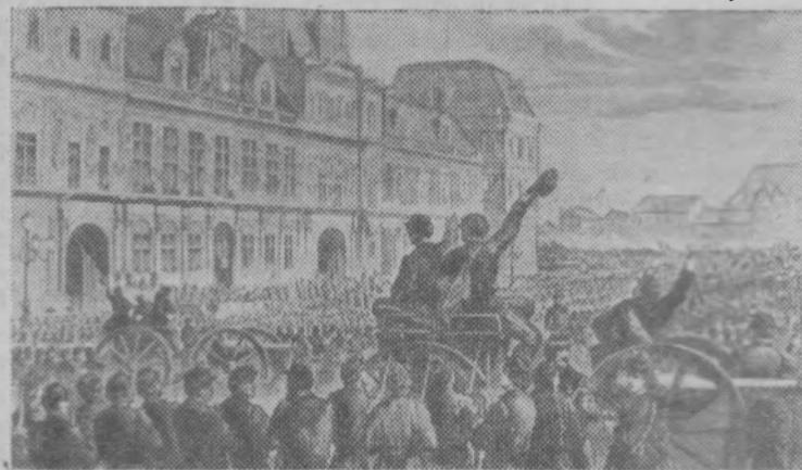
«Провозглашение Коммуны на площади перед Ратушей». Рисунок из фондов Музея К. Маркса и Ф. Энгельса.

„Париж рабочих с его Коммуной всегда будут чтить как славного предвестника нового общества...“ К. Маркс.