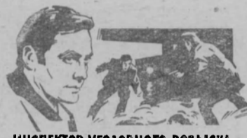
ИНСПЕКТОР УГОЛОВНОГО РОЗЫСКА

Уже само название фильма говорит о том, что в нем, пойдет речь о работниках милиции, стоящих на страже советского закона и порядка, охраняющих мирный труд и отдых наших граждан. Однако фильм «Инспектор уголовного розыска» нельзя охарактеризовать как чисто приключенческий. Скорее это психологический детектив. Здесь, правда, есть и преступники и сыщики, погони и выстрелы. Но главное внимание авторы уделяют самой специфике уголовного розыска, людям, которые не только по долгу службы, но главным образом в силу своего убеждения берут на себя ответственную задачу борьбы с преступностью и отдают ей все свои физические и умственные силы.