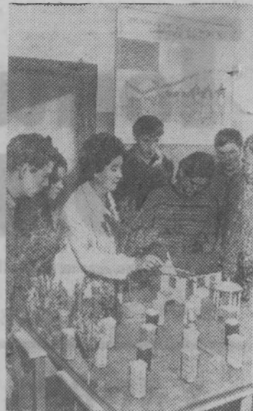
Краснодарский край. Армавирский зооветеринарный техникум за 40 лет существования подготовил 5760 специалистов. Сейчас здесь обучается около 700 человек. Кроме подготовки кадров, это учебное заведение занимается методической работой: оказывает консультативную помощь другим средним специальным учебным заведениям края, колхозным и совхозным специалистам. Методический кабинет ведет большую работу с заочниками.

Техникум располагает хорошо оснащенными кабинетами по химии, биологии, анатомии, лабораториями.