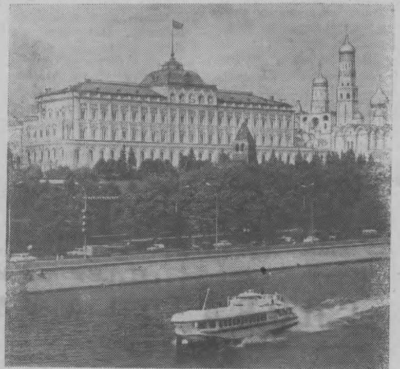
Москва. Большой Кремлевский дворец. 24 ноября 1971 года здесь откроется третья сессия Верховного Совета СССР восьмого созыва.