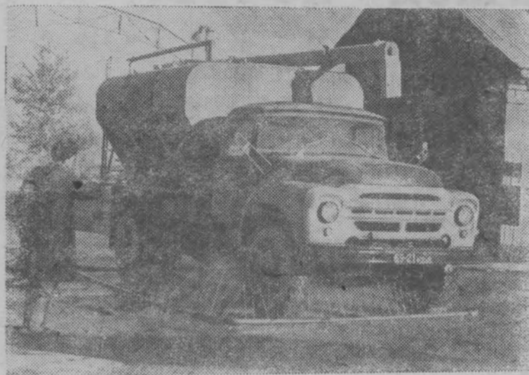
ПТИЦЕВОДСГВО—НА ПРОМЫШЛЕННУЮ ОСНОВУ

Кировская птицефабрика—передовая в Кировской области— в этом году продаст государству 30 миллионов яиц. А ведь