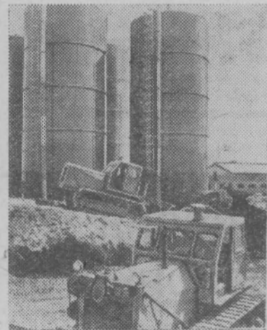
Запорожская область. В экспериментальном хозяйстве «Рассвет» Центрального института механизации и электрификации животноводства Южной зоны строится животноводческий комплекс для содержания 1200 коров.