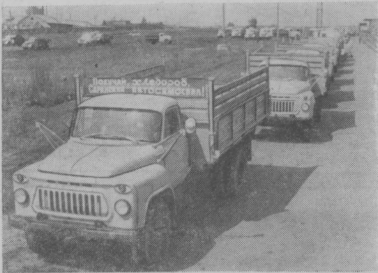
Мордовская АССР. Ежедневно из ворот Саранского завода автосамосвалов отправляются в разные области страны колонны машин. С каждым годом предприятие набирает силу. С начала пятилетки выпуск автомобилей увеличился на 30

процентов. Подавляющее большинство их идет в села страны.