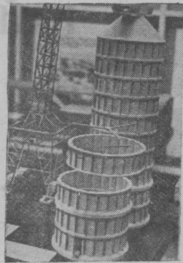
Москва. В разделе «Строительство» ВДНХ СССР открыта тематическая выставка «Отделочные и строительные материалы».

На снимке: макет строительства емкостей из сборных железобетонных, предварительно напряженных, тонкостенных панельных оболочек диаметром 12 метров и высотой от 2,4 до 3-х метров. Они предназначены для хранения всех видов зерна, а также промышленных сыпучих материалов.